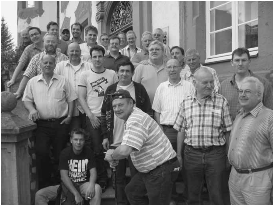
Die Ausflügler vor dem Bonndorfer Schloss