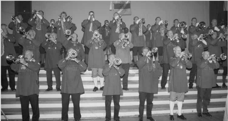
Fanfarenzug-Oldies beim Jubiläum 50 Jahre FZ 11.11.