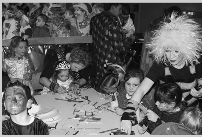
Kindernachmittag in der Scheffelhalle

Mi, 22.02.2006, 17 Uhr Scheffelhalle Fr, 24.02.2006, 11 Uhr Scheffelhalle